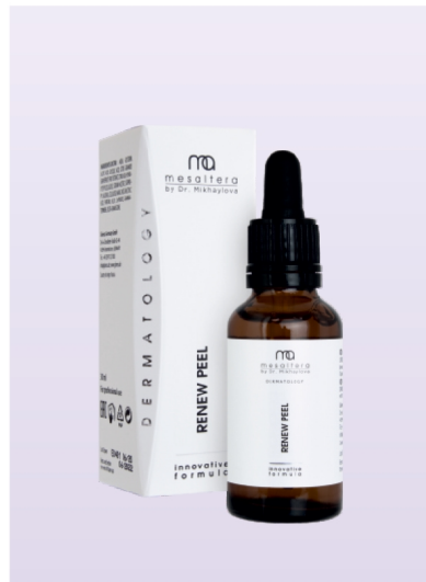
RENEW PEEL | 30 ml

Пилинг маската подпомага дълбокото почистване на кожата и премахва комедоните. Благодарение на съдържанието на гликолова киселина той има силно изразено екسفолращо действие, изглажда и озарява кожата и изглажда бръчките. Колагенът и еластинът подпомагат бързото възстановяване на кожата. Комплексът от растителни екстракти осигурява успокояващ, омекотяващ и тонизиращ ефект.