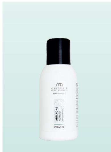
ANTI ACNE Complex | 100 ml

Предназначен за почистване, тонизиране и грижа за мазна и проблемна кожа с акне. Салициловата киселина осигурява эксфолиращо действие, омекотява комедоните. Ac.Net™ Complex™ блокира появата на акне и комедони и се бори със свръхпроизводството на себум. Комплексът Trikenor™ Plus има антимикробни и успокояващи свойства. Пантенолът и алантоинът овлажняват, омекотяват и успокояват, като подпомагат обновяването на кожата. Не съдържа алкохол и не изсушава кожата.